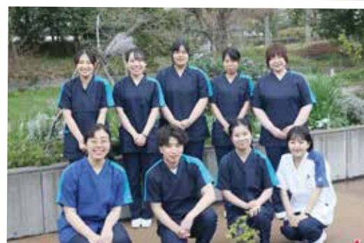
看護部・薬剤科・栄養科