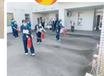
消火器の取り扱いを再確認！