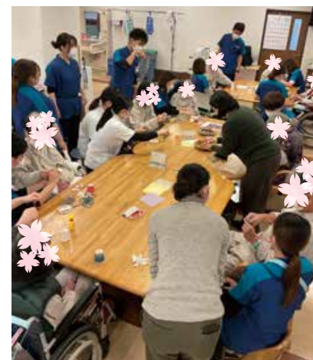
リハビリ室にて制作の様子