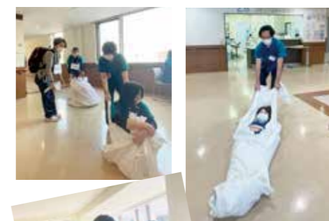
シーツを使用し搬送します