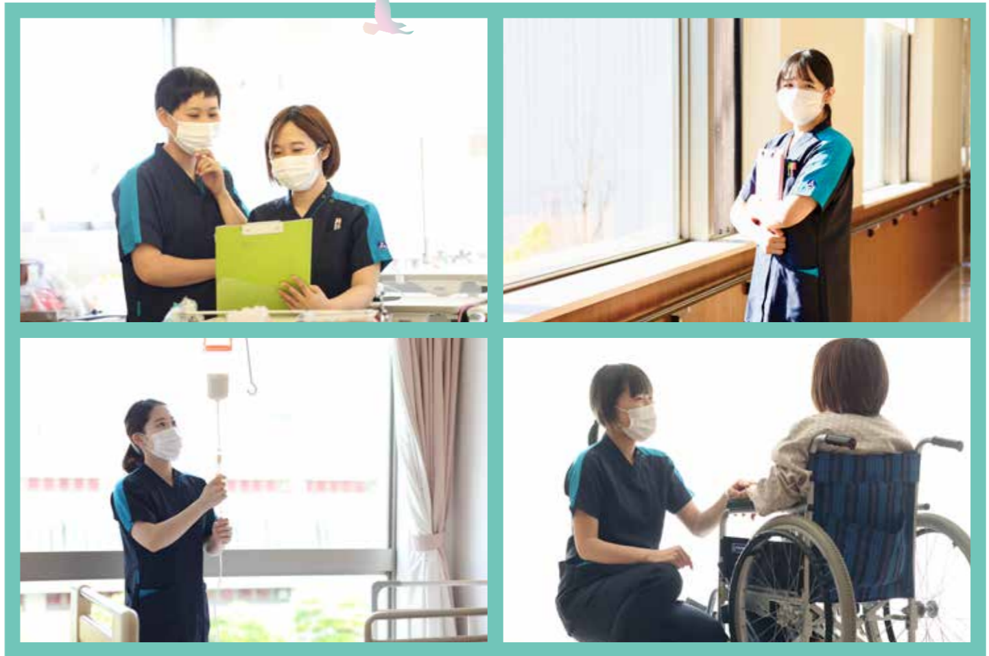
病院で働く看護師達の日常風景