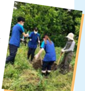
じゃがいもの土寄せ