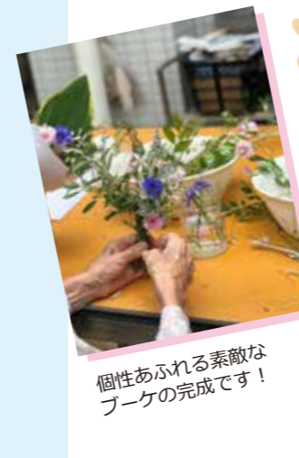
個性あふれる素敵なブーケの完成です！

リハビリガーデンに咲いている草花で、患者様と一緒にミニブーケを作りました。また、この日はバケツで簡単にできる「バケツ稲」の制作やじゃがいもの土寄せも行いました。